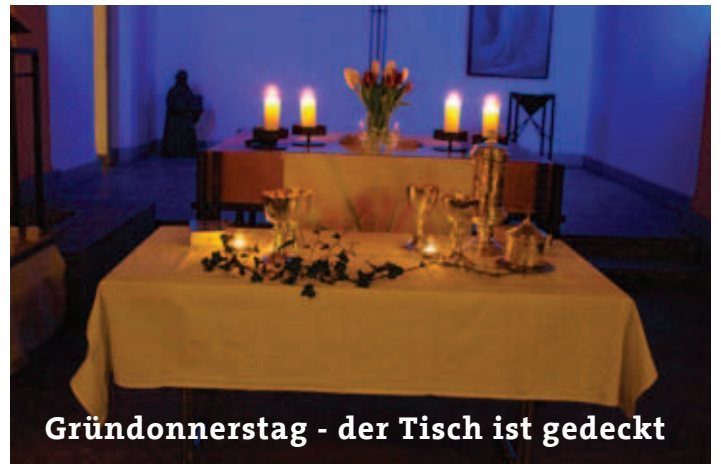
Gründonnerstag - der Tisch ist gedeckt

50, 60, 65, 70 oder 75 Jahre ist es her, dass die Jubilare ihre Konfirmation gefeiert haben. Wir haben alle Jubelkonfirmanden, deren Adressen wir haben, Anfang März angeschrieben. Falls Sie gern teilnehmen möchten, aber – aus welchem Grund auch immer – keine Einladung erhalten haben, melden Sie sich bitte im Pfarramt Brunnenreuth (Tel. 08450-7075), damit wir die Einladung noch nachholen können, und möglichst viele Menschen kommen können, um dieses schöne Fest gemeinsam zu begehen. GS